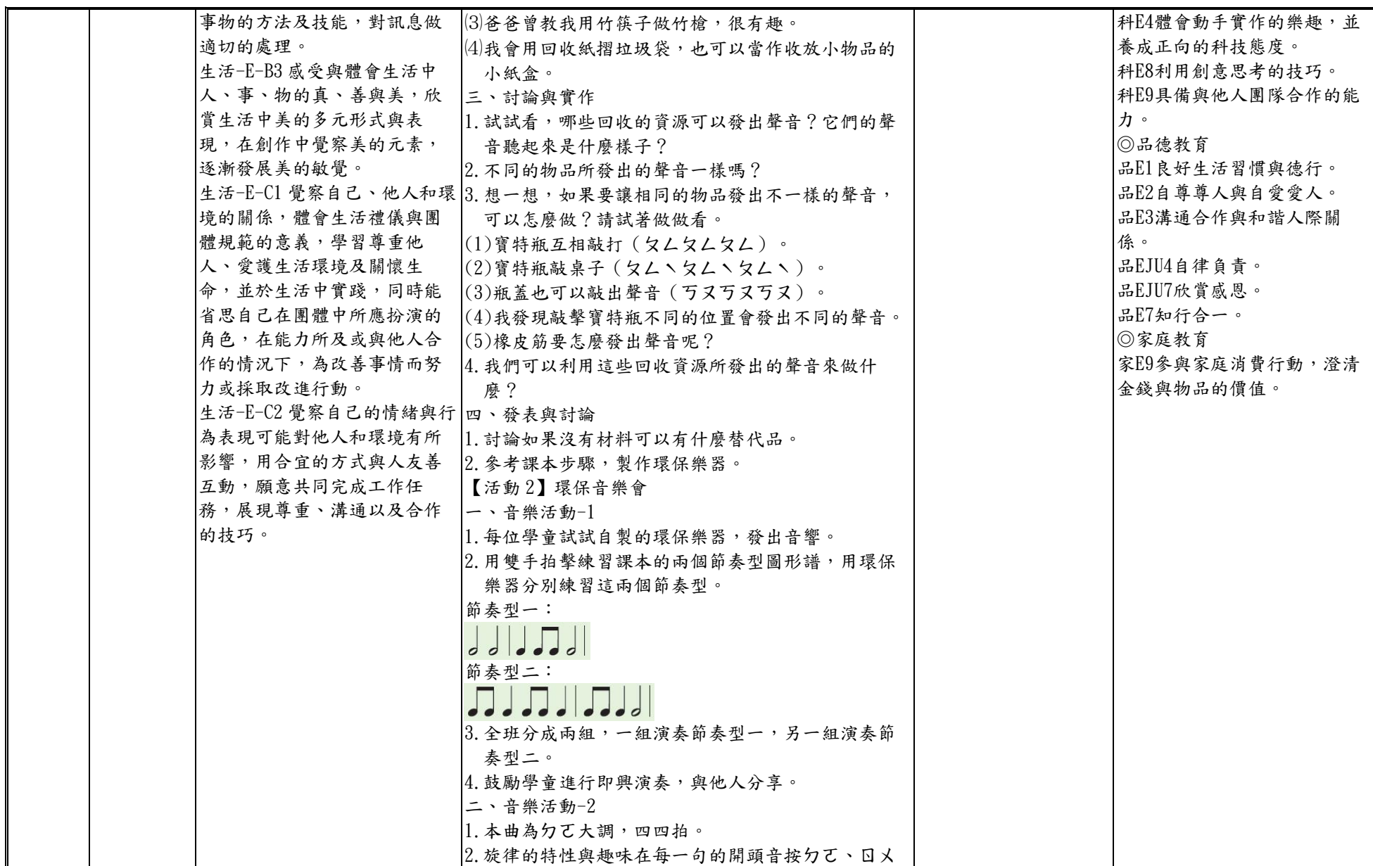
附件 2-5 (一至四／七至九年級適用)