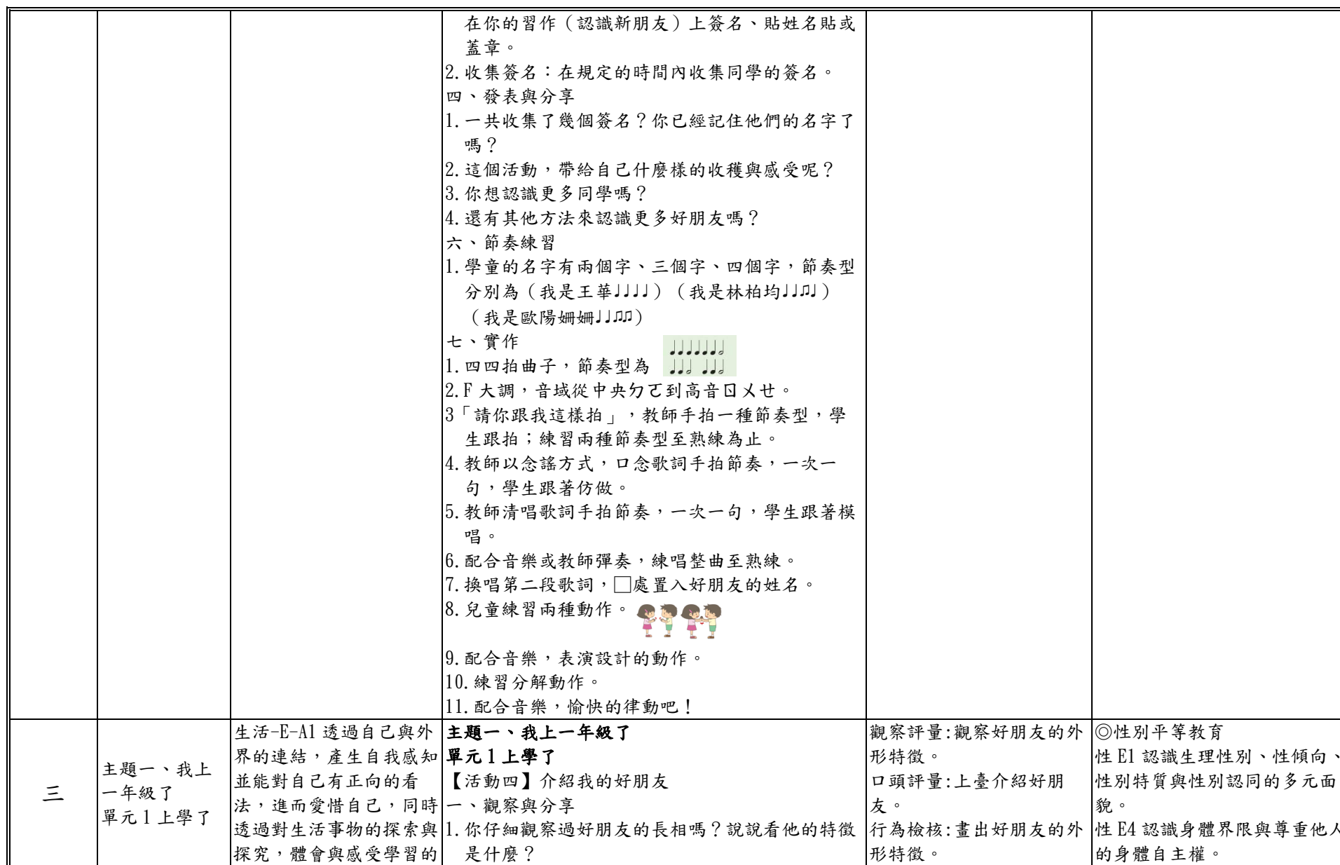
附件 2-5 (一至四 / 七至九年級適用)