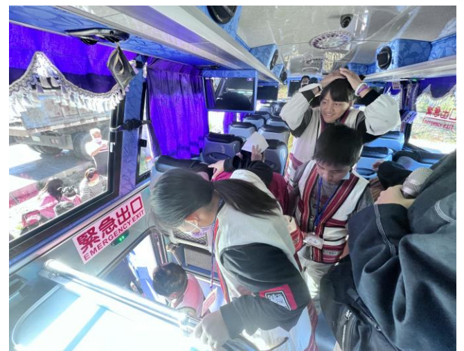
說明：校外教學遊覽車逃生演練。