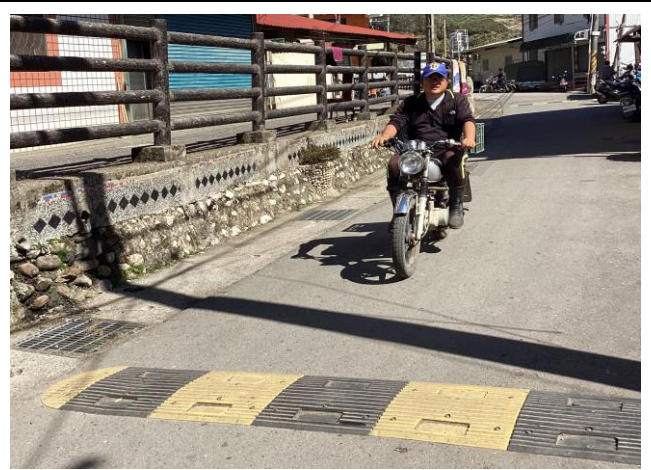
說明：帶學生到部落踏查交通環境。