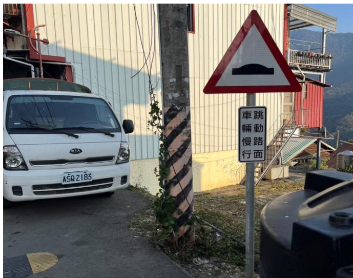
說明：部落探訪交通標誌。