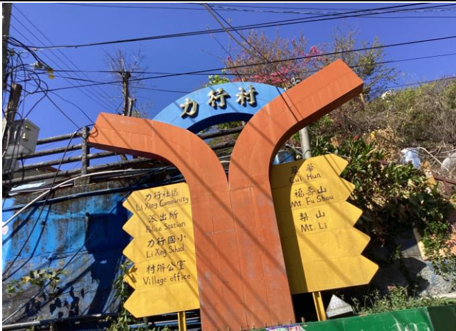
說明：帶學生到部落踏查交通環境。