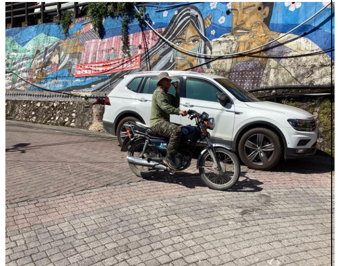
說明：踏查部落的交通工具。